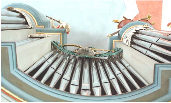
Kleine-Barockorgel von 1795, restauriert 2008 von Orgel- baumeister Hubert Fasen

Weitere Informationen zur Barockorgel finden Sie unter: